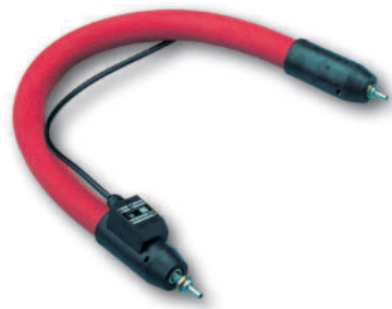
Analyseheizschläuche Analytical heated hoses