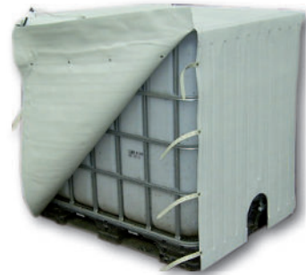
Heizplanen Heater tarps