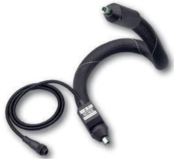
Industrieheizschläuche Industry heated hoses