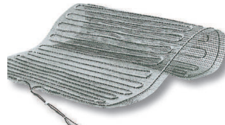
Heizmatten Heating mats