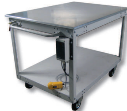
Heiztische Heating tables