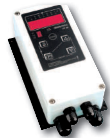
Temperaturregelgeräte Temperature controllers