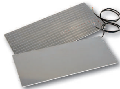
Heizplatten Heating plates