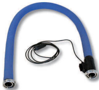
beheizte Wasser-/ Lebensmittelschläuche heated water-/ foodstuffs hoses