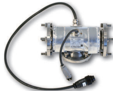
Heizmanschetten Heating sleeves