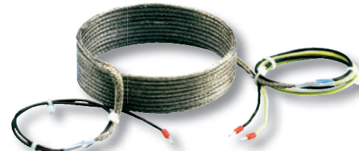
Heizbänder Heating cords